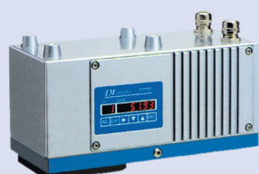
赤外線水分計 IRMAシリーズ