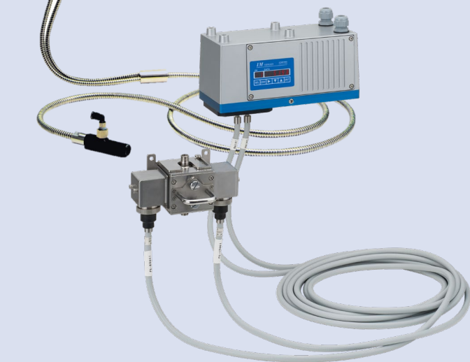
危険エリアに 防爆仕様 IRMDシリーズ